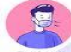
Wear a face mask if you are sick