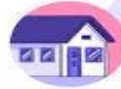
Stay at home