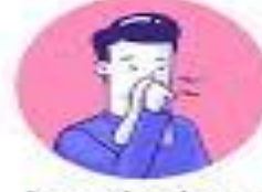
Cover coughs and sneezes