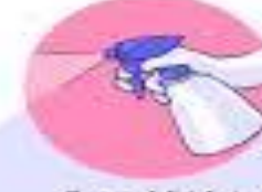
Clean and disinfect