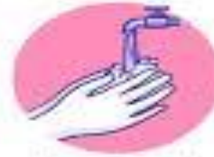
Clean your hands often