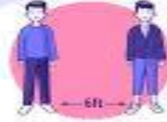
Avoid close contact